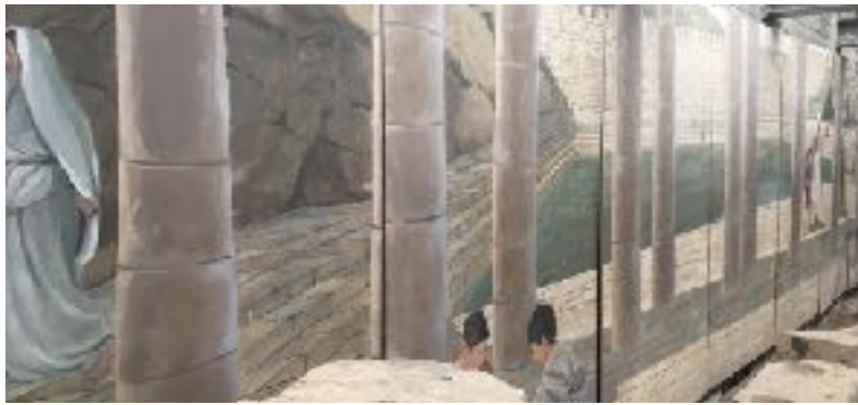
西羅亞池的想像圖

今天，兩個水池已經面目全非，再沒有水留在池的遺址裡。隨著聖殿的被毀，人們再沒有淨身的需要。現在只能夠運用個人的想像力，懷緬過去朝聖者遠道而來的熱鬧情境。