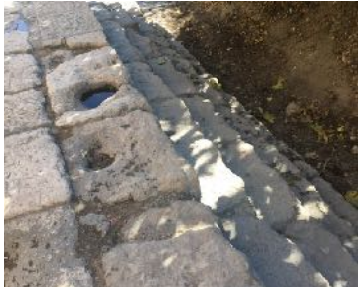
2004年發現西羅亞池的遺址，現只剩下池邊的台階

事實上，用來行潔淨禮的水池，它本身並沒有任何魔法，更不會讓人得到真正的潔淨。但透過耶穌基督的使用，卻成為人得醫治工具。