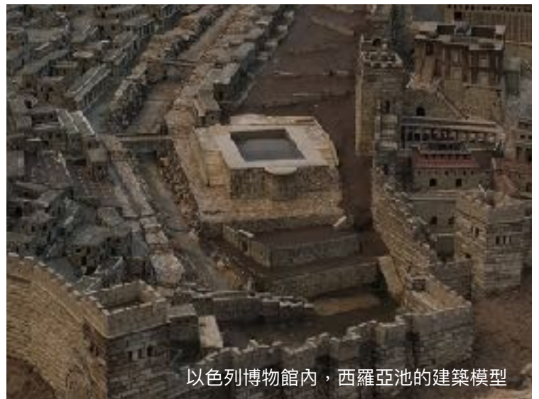
以色列博物館內，西羅亞池的建築模型

雖然，我們再尋不著淨身池，聖殿也不再復見。不過，醫治人身心靈的上帝，卻仍然活著。祂不但赦免我們的罪、得到真正潔淨。更藉著聖靈，教導我們過聖潔的生活，以清潔的心迎見上帝。 ——黎光偉